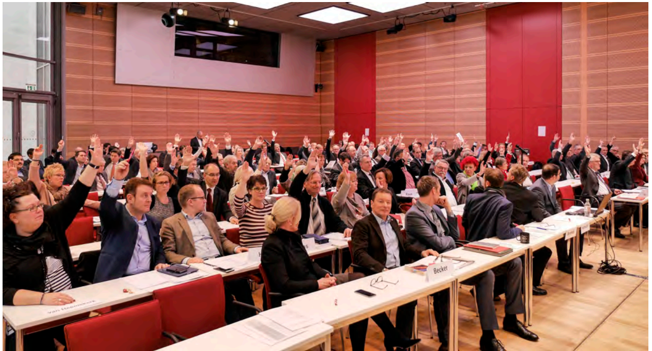
Abstimmung der dbb Gremien

Dieses Mehr an Herausforderungen ist nicht ohne ein Mehr an Perspektive, an Struktur und an Klarheit zu bewältigen. Dem tragen unsere Forderungen Rechnung: