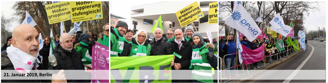
21. Januar 2019, Berlin