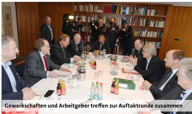
Gewerkschaften und Arbeitgeber treffen zur Auftaktrunde zusammen