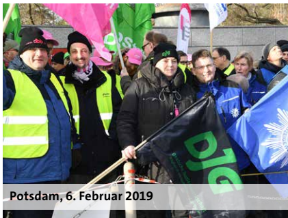
Potsdam, 6. Februar 2019