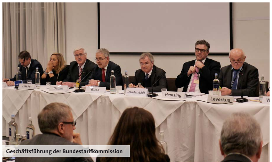
Geschäftsführung der Bundestarifkommission

„Mit der Stufe 6 ist es uns gelungen, die finanzielle Situation der Lehrkräfte im Tarifbereich kurzfristig und spürbar zu verbessern. Dieser deutlichen Verbesserung haben wir unser Ziel, die Entgeltordnung für Lehrkräfte in dieser Einkommensrunde weiter auszubauen, untergeordnet“, erklärt Russ und macht deutlich: „Beides – Erhöhung der Angleichungszulage und Einführung der Stufe 6 – war nicht durchzusetzen. Wir haben uns dafür